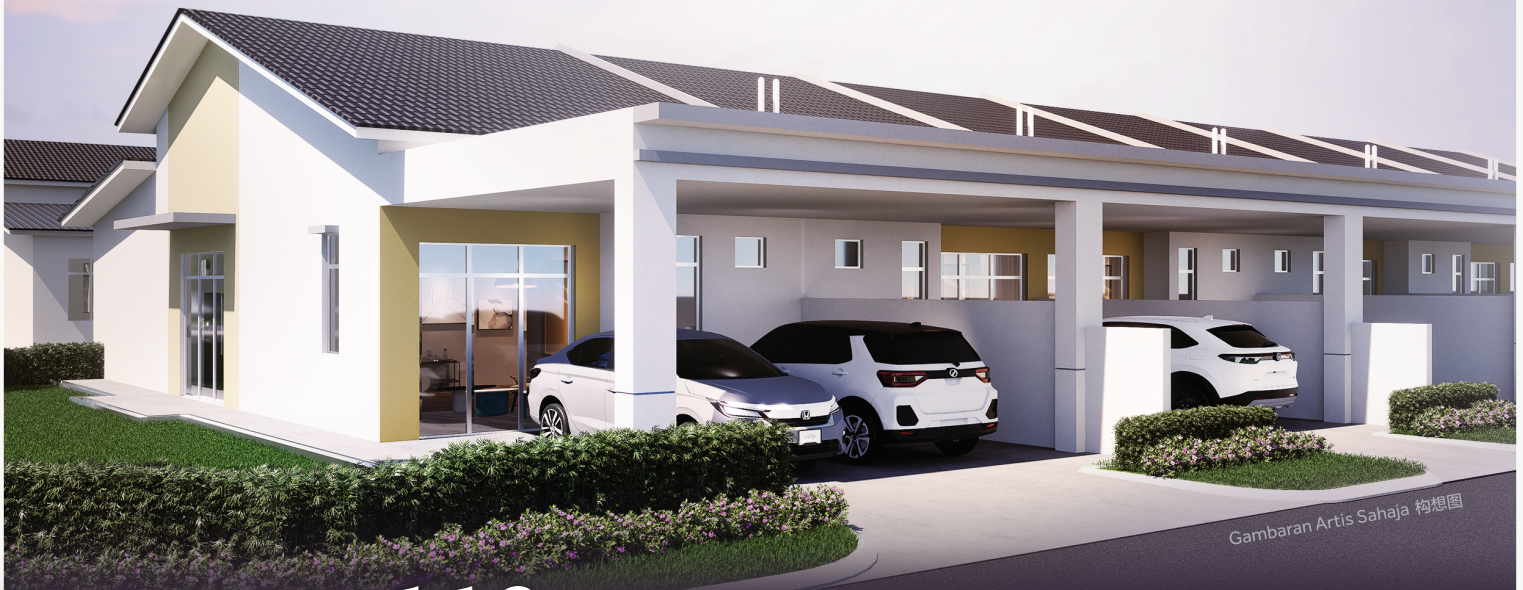
Gambaran Artis Sahaja 构想图

North Precinct - 112 ekar Perbandaran yang Dirancang dengan Teliti