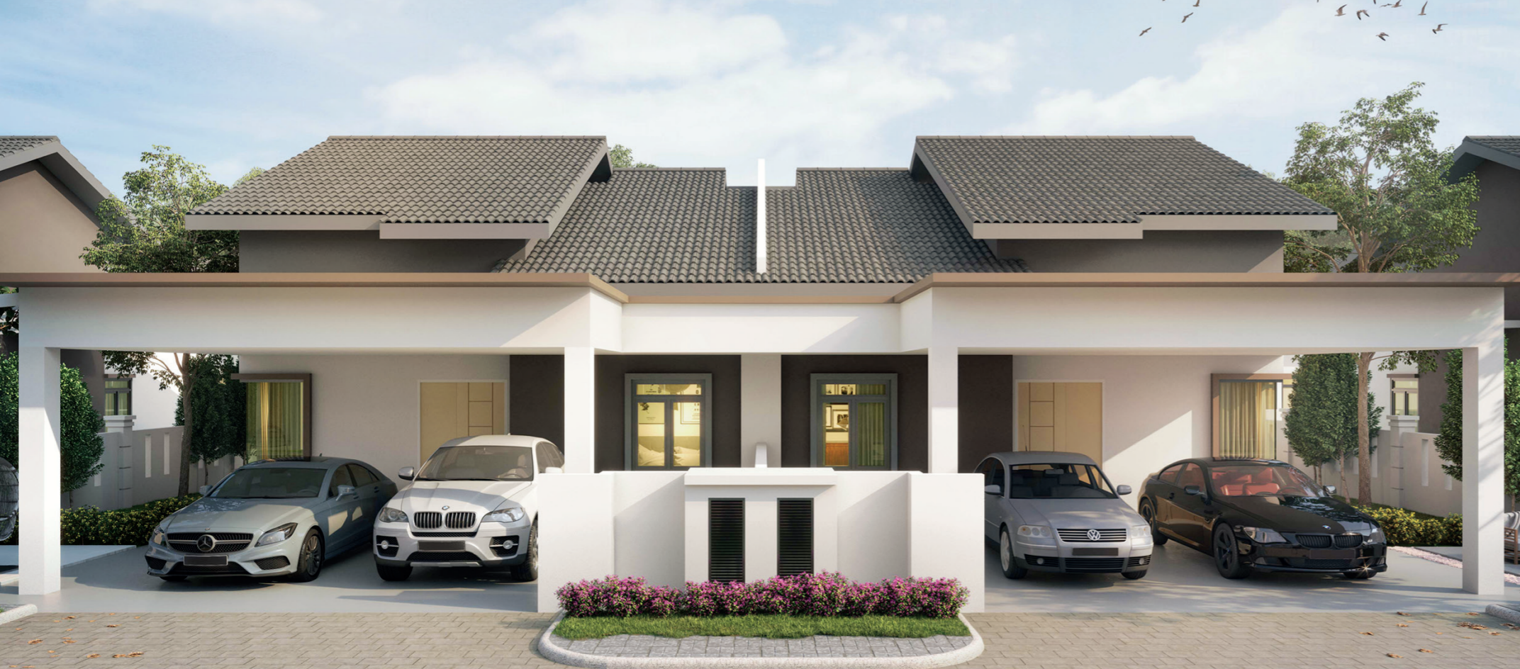
Gambaran Artis Sahaja 构想图