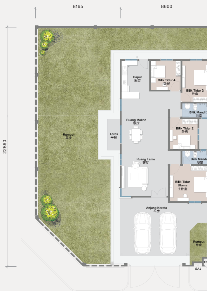
Pelan Tingkat Bawah 底楼平面图

FTB dan FWS sedia ada memudahkan pemasangan WiFi secara terus 备有 FTB和FWS可直接安装WiFi