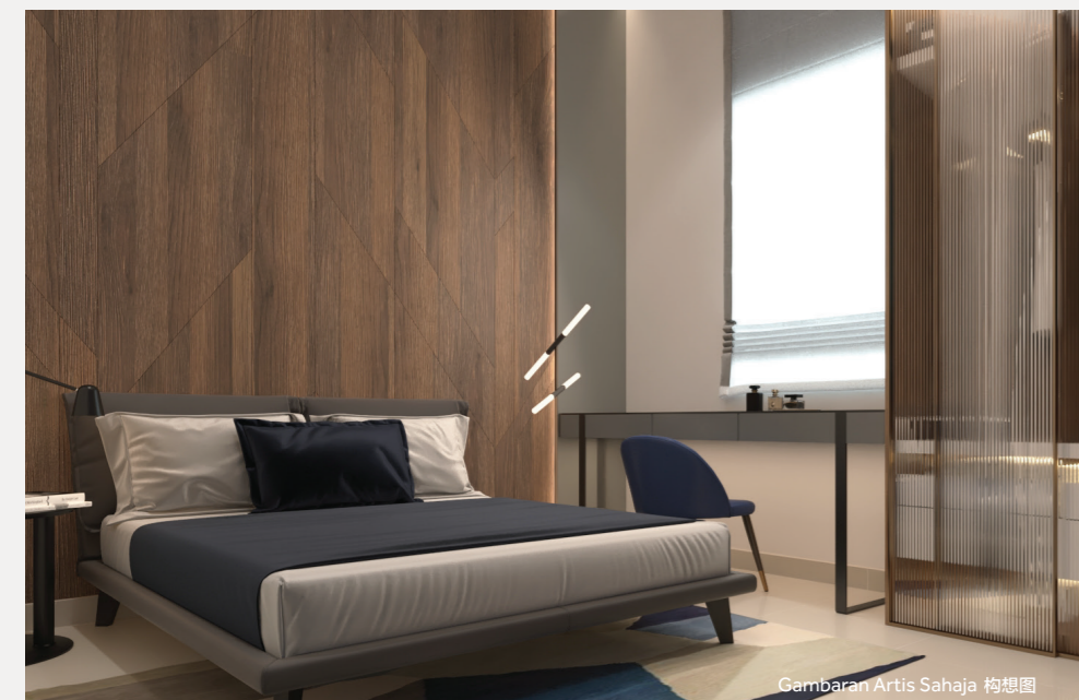
Gambaran Artis Sahaja 构想图