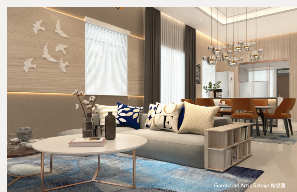
Gambaran Artis Sahaja 构想图