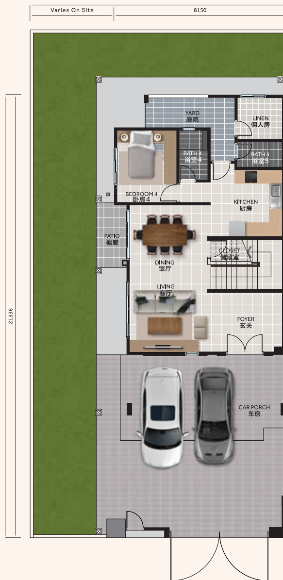
Ground Floor 底楼