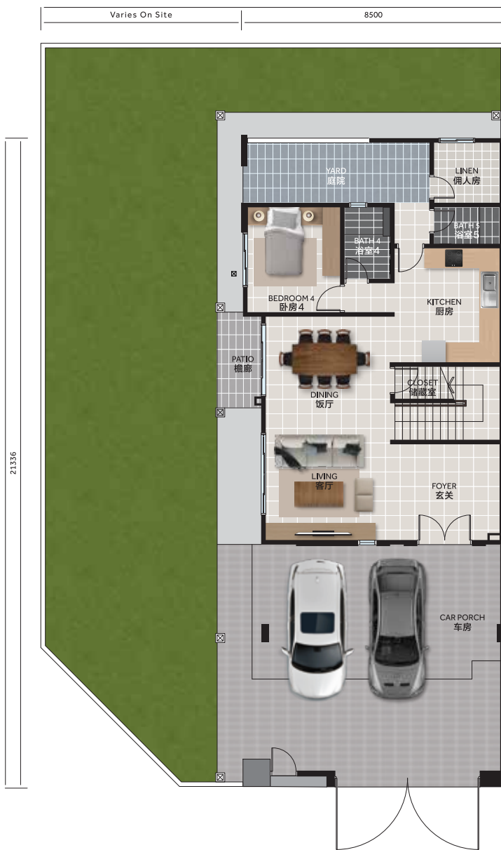
Ground Floor 底楼